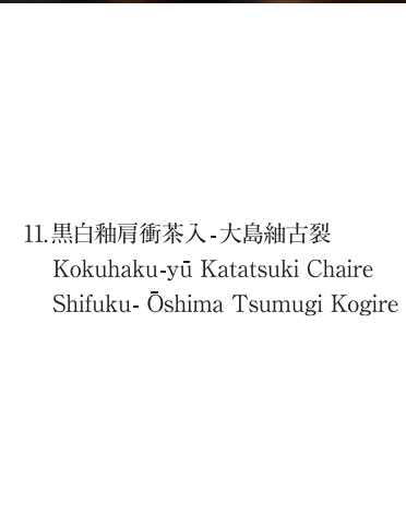
11. 黒白釉肩衝茶入 - 大島紬古裂 Kokuhaku-yū Katatsuki Chaire Shifuku- Ōshima Tsumugi Kogire