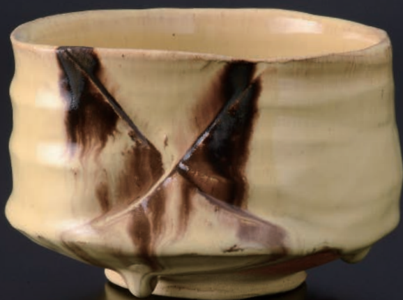
3. 今古釉茶碗 / Konko-yū Chawan