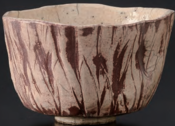
8. アメリカRAKU茶碗 / America Raku Chawan