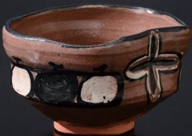
9. 赤織部茶碗 / Aka Oribe Chawan