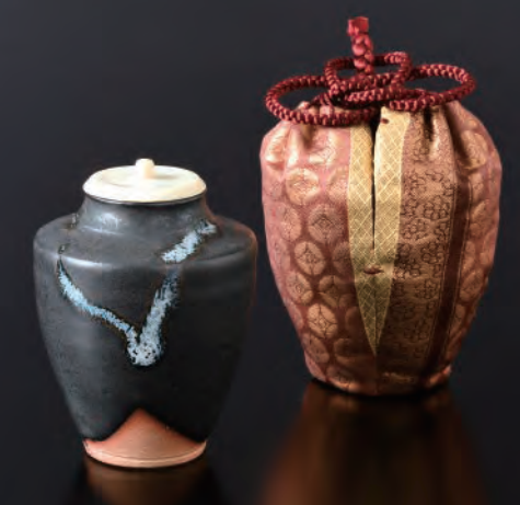
10. 黒白釉肩衝茶入 - 蜀金金襴 Kokuhakū-yu Katatsuki Chaire Shifuku- Shokkin Kinran