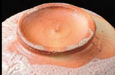
2. 茶灰釉茶碗 鵬雲斎大宗匠御書付 Chabai-yū Chawan Hōunsai Daisōshō Okakitsuke